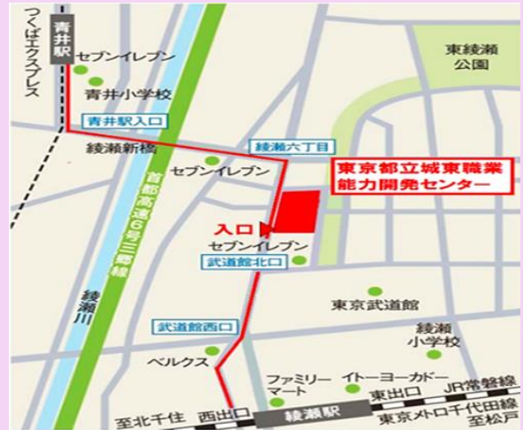
【第6回会場】城東職業能力開発センター (足立)

◆ 東京メトロ千代田線 綾瀬駅下車 徒歩8分 ◆ つくばエクスプレス 青井駅下車 徒歩12分